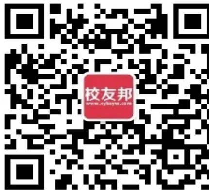
校友邦教师版公众号二维码

以上操作过程中，如有疑问，可联系校友邦对应老师或在线客服，电话：0579-82722068